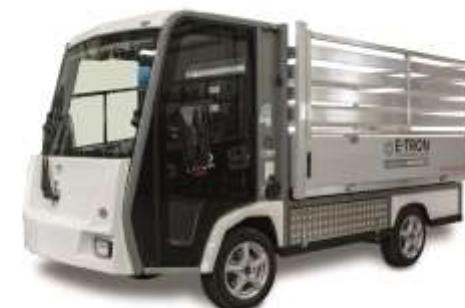
PRO Litium MAX