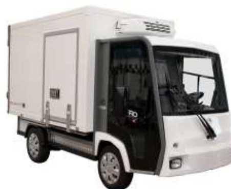
PRO Litium MAX kylbil